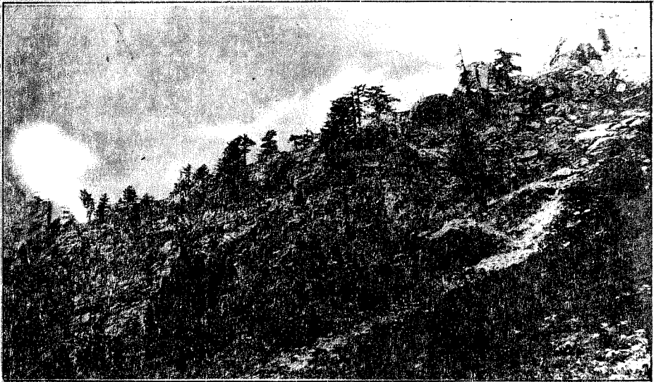
Fig. 2. - Munikove šume sev. Prokletija Munika pine forests on north Mt. Prokletije

Međutim, s druge strane, takve državničko-geografsko-regionalno određene prostorne celine, Makedonija i Crna Gora, pored već dve ogromne i suštinski i regionalno različite regije (mediteranska i submediteranska, s jedne strane, i alpijske – visokonordijska s druge strane), ekološki i biogeografski toliko raznovrsne, da je tu krajnju specifičnost nemoguće izraziti terminima koji su jasni samo u najširem smislu, u krajnjem slučaju neke opšte orijentacije (Makedonija, Crna Gora). Ali, tu postoji jedna određena stupidna začkoljica. Pošto državne granice nisu prirodne (u smislu prirodnjačke), već antropogeno-istorijske i državničke, može se desiti da neka asocijacija „macedonicum” uđe (ili je već bila tamo odvajkada), u Srbiji, jer se Pinus mugo ne oseća ni kao „Makedonac” ni kao „Srbin”! Hoćemo li, u tom slučaju, tu istu asocijaciju sada zvati umesto „macedonicum, u serbicum” ili u suprotnom slučaju, ovaj „serbicum”, ako se nalazi u Makedoniji zvati opet „macedonicum”, i tako dalje u nedogled. Mislim da je ovaj slučaj, i svi slični, ovakav način „krštavanja” biljnih asocijacija krajnje apsurdan i stupidan!