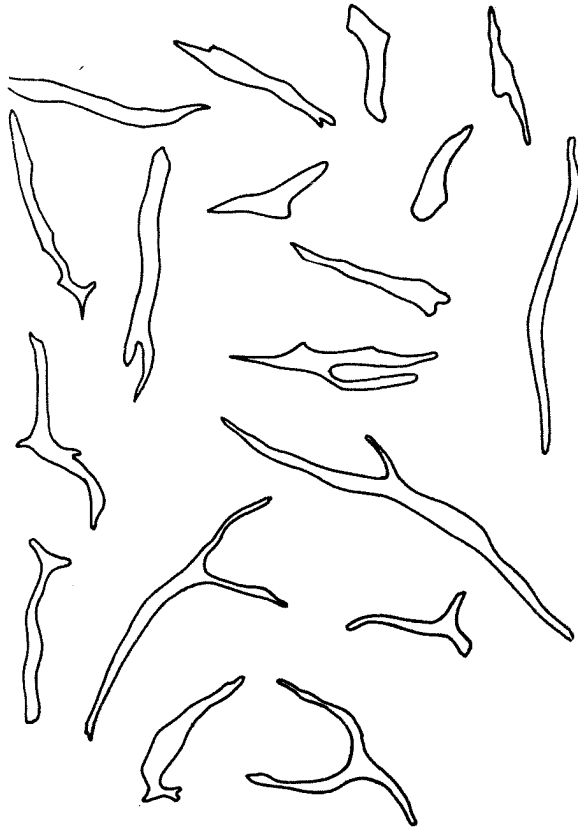
Sl. 1. Ćelije tkiva endokarpa Trapa L. (100 x). Original.

Pod dejstvom floriglucina i sone kiseline zidovi ćelija koje grade endokarp boje se crveno, na osnovu čega je zaključeno da su lignifikovani.